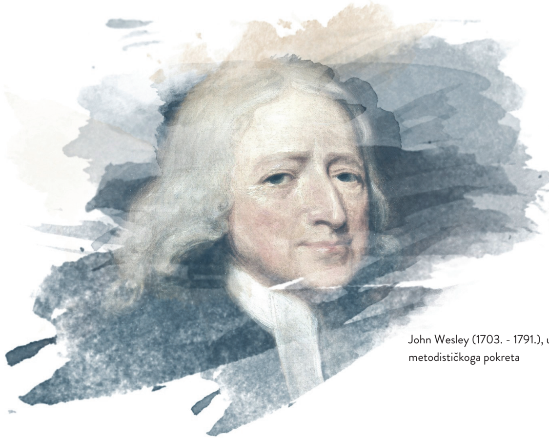
John Wesley (1703. - 1791.), utemeljitelj metodističkoga pokreta