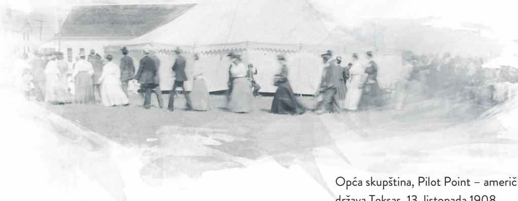
Opća skupština, Pilot Point – američka savezna država Teksas, 13. listopada 1908.

Na 5. Općoj skupštini 1919. godine naziv denominacije promijenjen je u The Church of the Nazarene (Crkva Isusa iz Nazareta). Naziv pentekostni tada se više nije podudarao s učenjem o svetosti, kao što je to bilo krajem 19. stoljeća. Nova je denominacija ostala dosljedna svojoj prvotnoj službi propovijedanja evanđelja cjelovitoga spasenja.